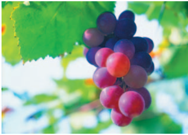
葡 ㄉㄨˊ 萄 ㄊㄠˊ