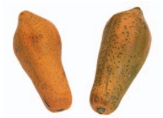
木 キ 瓜 カ