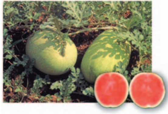
西 セイ 瓜 カ