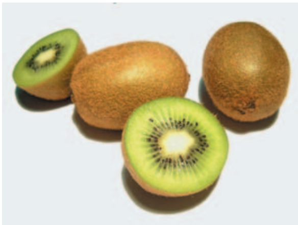
奇 ㄑㄧˊ 異 ㄧˋ 果 ㄍㄨㄛˊ