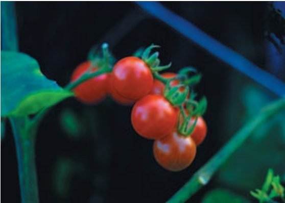
番 パン 茄 カ