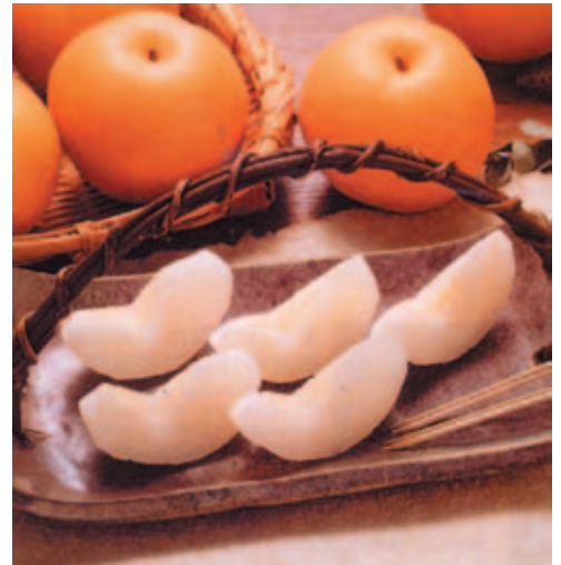
梨 ㄌㄧˊ 子 ㄉㄨˊ