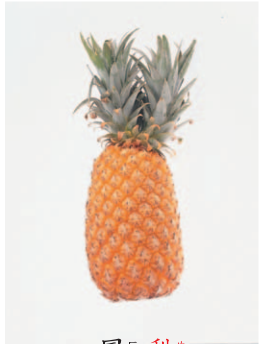
鳳 ㄈㄨㄥˋ 梨 ㄌㄧˊ