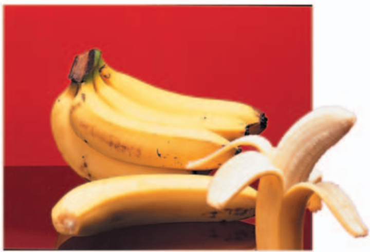
香 ㄒㄩㄥ 蕉 ㄐㄧㄠ