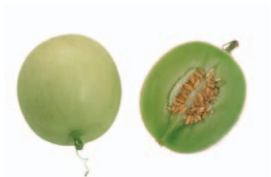
香 カウ 瓜 カ