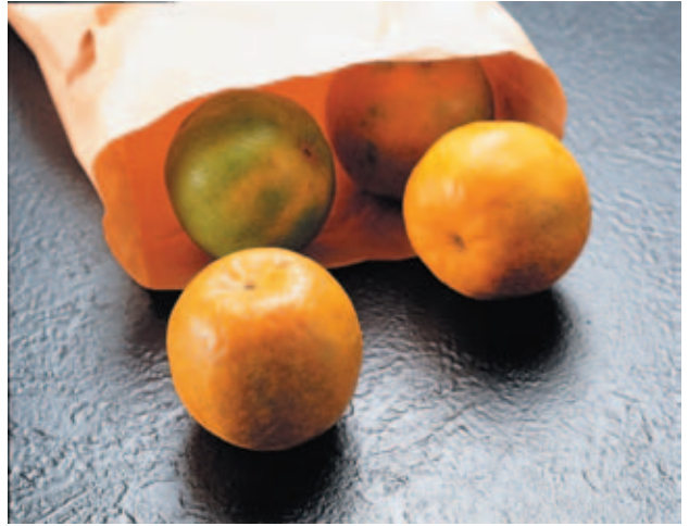
柑 カ 橘 キ